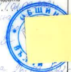
Таблица на площите